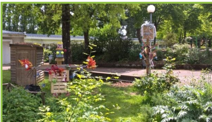
Les totems de la Semaine Sans Ecran